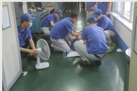
急召式生产安全事故预案演练