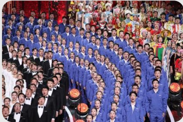
“黄河入海”交响音乐会