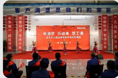
“中国梦·劳动美·职工情”慰问演出