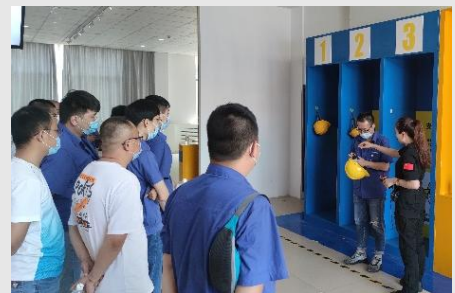
安全生产应急科普体验