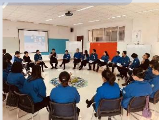
内训师引导技术培训