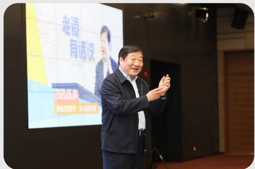
“老谭有话说”青年交流会

2020年5月4日，谭旭光董事长通过直播形式开展“老谭有话说”青年交流会，1万余名青年员工通过弹幕、小视频、场外连线、小游戏等方式与董事长进行“面对面”交流，并对董事长的奋斗寄语以及激情燃烧的青春岁月致以最崇高的敬意，进一步引导激励广大青年锻炼本领、扎根企业。