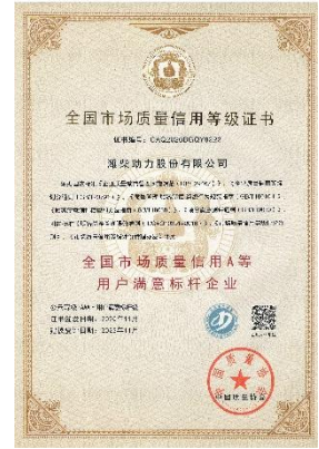
“全国市场质量信用 A 等用户满意标杆企业”证书