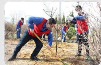
“植绿护绿”志愿活动