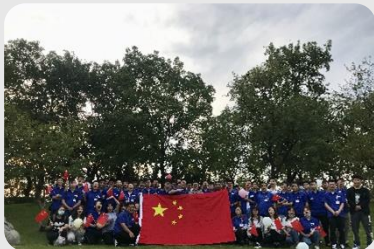
新入职员工户外拓展